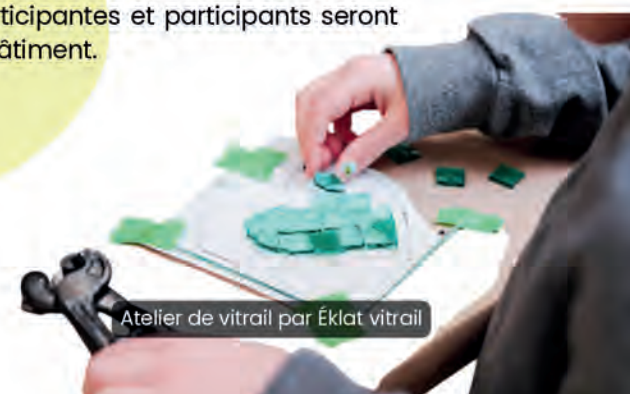
Atelier de vitrail par Éklat vitrail

Par ces activités, Vie culturelle et communautaire de Granby souhaite offrir au public une occasion de créer, d'écouter et de redécouvrir des lieux culturels bien ancrés dans la communauté.